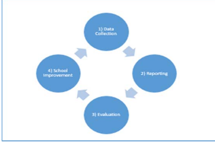
Şekil 1. Kurumsal Standartlara Dayalı Öz Değerlendirme ve Okulu Geliştirme Uygulamalarının Aşamaları

İKS dört temel aşamadan oluşur: veri toplama, raporlama, değerlendirme ve okul geliştirme. Bu aşamaların ilk üçü öz değerlendirme olarak nitelendirilir.